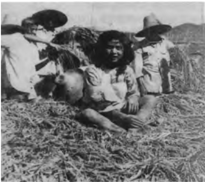
“卫星田”“密植”的稻穗竟能托住一位小姑娘,这是当时发表的照片

安徽是农业大省,1958年——1959年两年,虽有部分地区有水旱之灾,都是局部的,和邻近的江苏、浙江没有什么大的差异,即使1954年淮河决堤,淮北七县顿时成水乡泽国的特大水灾,