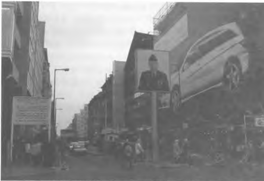
柏林墙最著名的哨所之一——“查理哨所”

1987年的春天,东柏林的文化圈里流传着一份没有标明出版日期及地点的秘密印刷品。细心的读者可以在符号