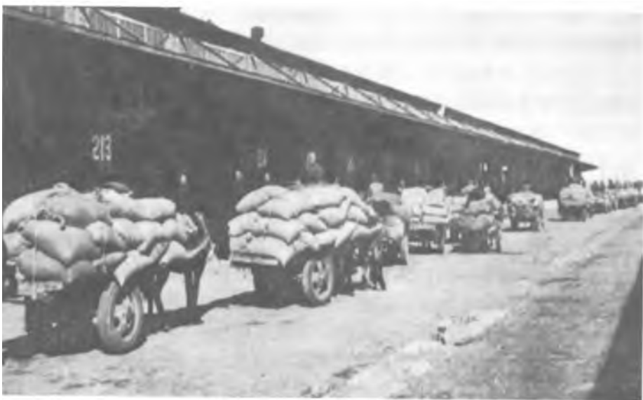
东北人民大力支持人民解放军作战,将丰足的军粮源源运往辽西战场

早在抗日战争时期,各根据地普遍进行了减租、减息、改善雇工待遇的运动,调动了工农群众的革命积极性。解放战争时期,进一步实行土地革命,获得土地的翻身农民,革命热情空前高涨,掀起一波又一波参军、参战、支前的热潮。农民不但成为人民解放军的主体,而且组成了更大规模的支前大军。例如,淮海战役我军参战部队共约60万人,而担负运送弹药、粮食、枪支,转运伤员等任务的民工,就达543万人,几乎等于参战部队的十倍。如果没有人民群众的拥护和支