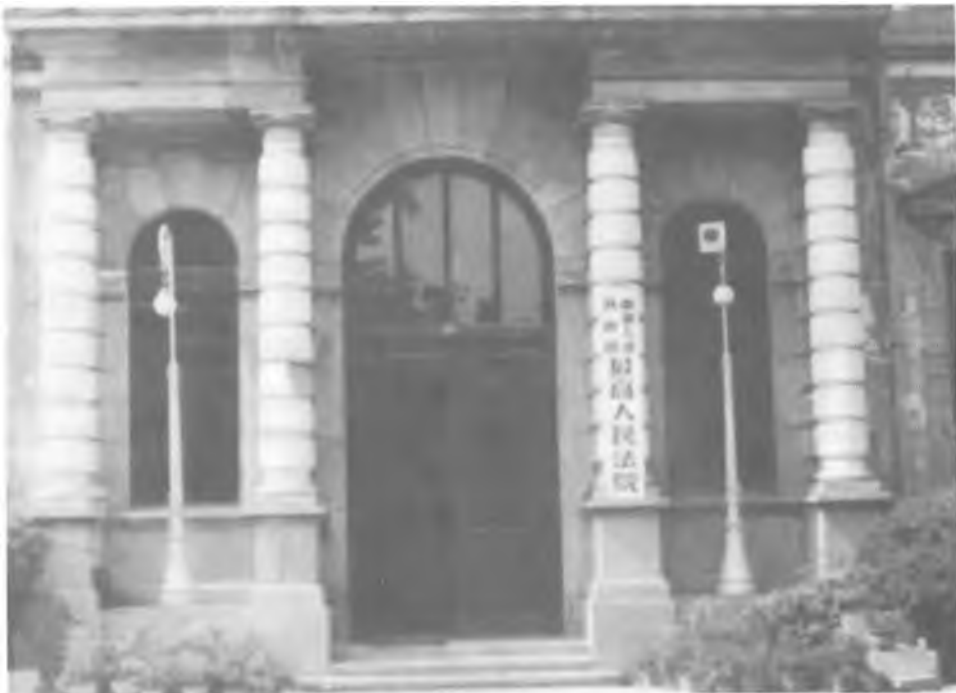
中华人民共和国最高人民法院