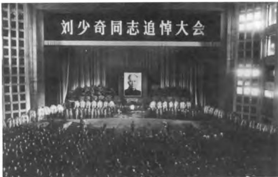
1980年5月17日下午,刘少奇同志的追悼大会在北京人民大会堂隆重举行

封有没有有暖气的房子,并告诉我刘少奇同志在那里的一军关着,中央还派了五个人,包括医生、护士。我告诉王新,开封有一套房子有暖气,是过去的一位副市长叫苟金笃的住的,现在暖气条件怎样不清楚,能不能住可以查一查。因为开封市除了工厂、招待所外,一般住房都没有暖气。以后王新怎样处理的我就不清楚了。”