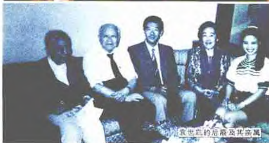
袁世凯的后裔及其亲属