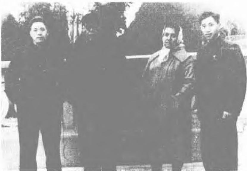
■本文作者李思慎（右一）和立三同志（左二）在一起

上述全篇谈话，涉及从1922年到1946年长达20多年时间，李立三先后三次与刘少奇在一起共事，他都看不出“刘少奇有什么大问题”。无论从当时正在全国轰轰烈烈地开展着的“文化大革命”运动这个特定的历史条件，还是从李立三、刘少奇当时的特殊处境来看，李立三面对极端险恶的形势，勇敢而公正地为已经成为“全国共诛之，全党共讨之”的所谓“叛徒、内奸、工贼”刘少奇作证，实在是非常难能可贵的。