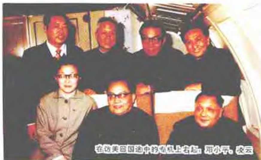
在访美国途中的飞机上右起：邓小平、姚云