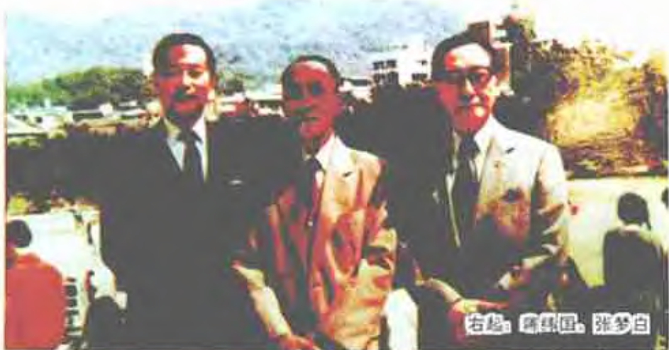
右起：蒋纬国、张梦白