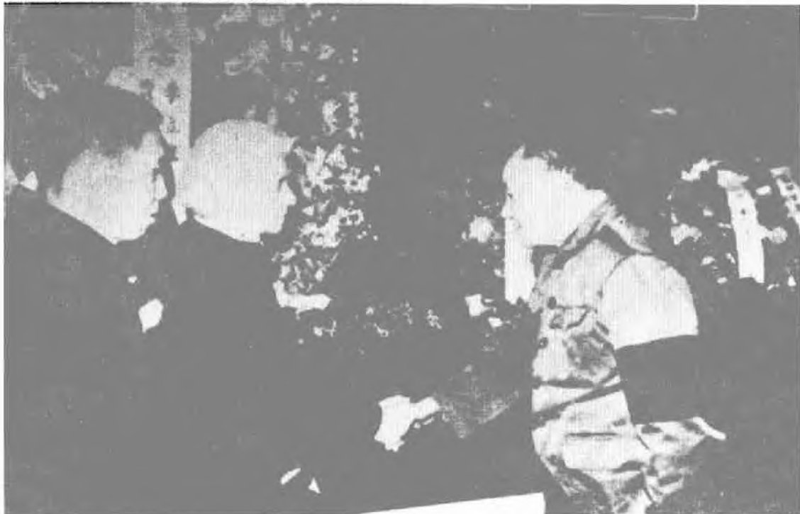
一九八〇年三月，在李立三的追悼会上，邓小平与李莎握手