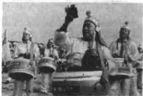
参加仪式的群众欢庆鼓乐队。