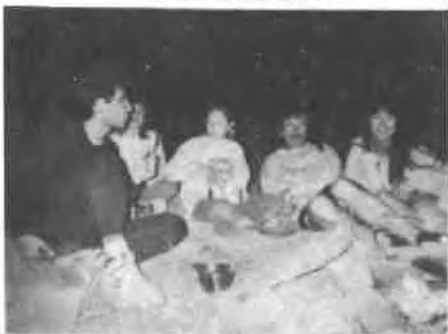
参加独木舟野营活动