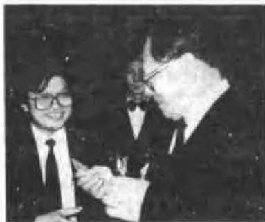
江泽民与姚美良亲切交谈

在庆祝新中国建立40周年盛大国宴上，江泽民总书记、李鹏总理都高兴地与一位年轻的海外实业家亲切握手，称赞他为弘扬中华文化和家乡建设做了许多好事，并同他合影留念。