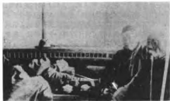
杜月笙控制的大烟馆“燕子窝”