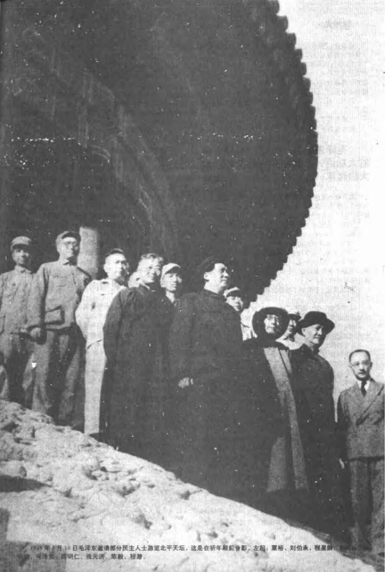
1949年2月10日毛泽东邀请部分民主人士游览北平天坛。这是在祈年殿前合影。左起：粟裕、刘伯承、程星桥、胡宗南、毛泽东、陈明仁、张元济、陈毅、程潜。