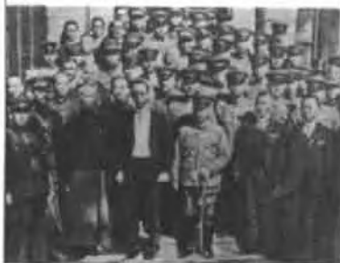
“日满议定书”签字后合影

上的“皇帝宝座”，又对他此后的前途命运危惧不安的思绪中换上了早已为他准备好的日本军帽和军大衣，换乘日本军车到了约定的码头，同早已等在那里的郑孝胥等人一起，上了“比治山丸”号汽船，闯过了中国驻军哨卡，偷渡过海河，半夜时分抵达大沽港外，登上了早已停泊在那里的“淡路丸”号日本商船，溥仪离开了他“寓居”七年的天津。（责任编辑：晓渡）