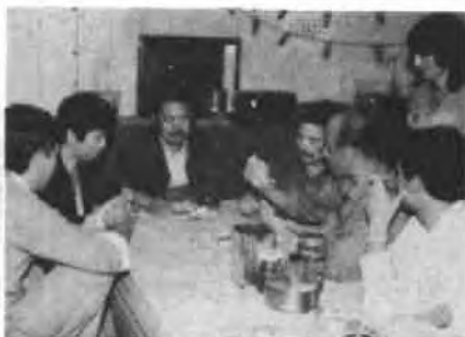
八小时之外，两岸海员在一起打扑克 人放火的事也报道，用于教育人民。