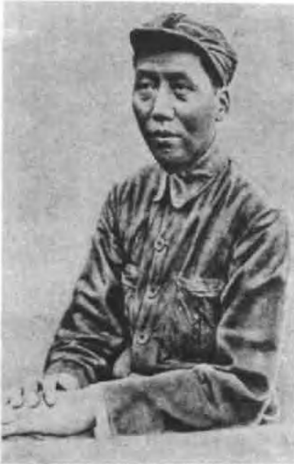
前排，右一—张闻天、右二—莫洛托夫，前排左一—布尔加宁，后排左一—米高扬