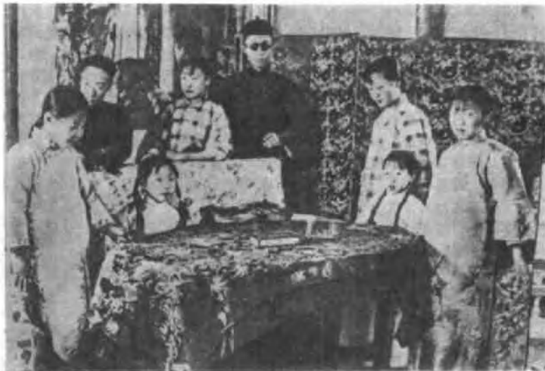
天津生活与弟弟妹妹

表之类交给他，他可以拿这些东西出去给溥仪联络一些军界人物，以便使他们共同“赞襄复辟大业”。这样的“香饵”溥仪怎能不吞，于是慷慨解囊，叫他一批一批地拿去那些最值钱的东西。后来刘凤池竟指名要这要那。有一次他说去活动张作霖的部下邹作化，竟公然提出：“小物品不能动其心也，应送其珍珠、好宝石或钻石，按万元左右贵重物予之，当有几十倍大利在也。”这些人从来没有拿出什么实际成绩给溥仪，只是无止境地伸手，既要东西又要钱，溥仪抱着少有的耐心，对他们寄予深深的希望。