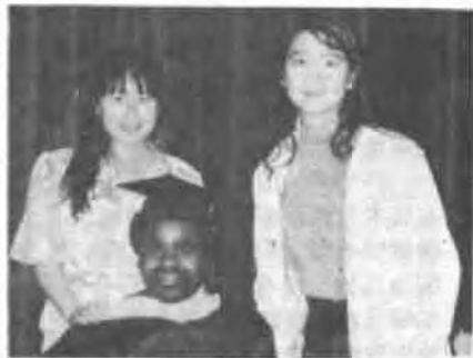
参加友人的毕业典礼