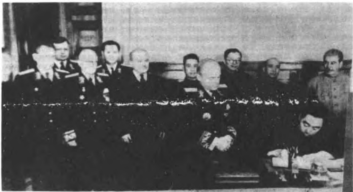
这是周总理 9 月 15 日在中苏联合公报上签字。右起：斯大林、李富春、张闻天、尤金、粟裕、莫洛托夫

缩到 20 页送交斯大林等人传阅，等了好多天，在周恩来回国前夕，才以共产国际执行委员会的名义作了对周恩来报告的决议。决议很笼统，基本内容是：中国抗日战争在世界革命中所占的重要地位和重大的历史意义；抗日战争的胜利进展对中华民族解放事业的伟大意义；维护统一战线，一致对外，把抗战胜利地坚持下去，取得最后胜利，这是全民族的主要任务和唯一目标，等等。无异于一封劝告书或建议信。实际上，分歧依然存在，只是不再公开暴露，保持了沉默而已。