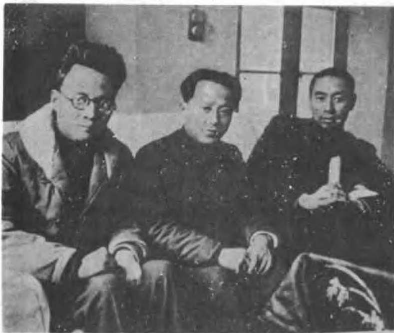
中共中央代表团、中共长江局负责人王明（中）、周恩来（右）博古（左）