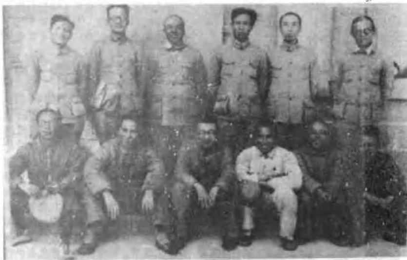
1937年12月9日至14日，中共中央在延安召开政治局会议。张闻天在会上作了《目前的政治形势和党的任务》的报告。这是列会同志的合影。前排右起：刘少奇、陈云、王明、凯丰、项英。后排右起：毛泽东、周恩来、秦邦宪、林伯渠、张闻天、彭德怀、康生。