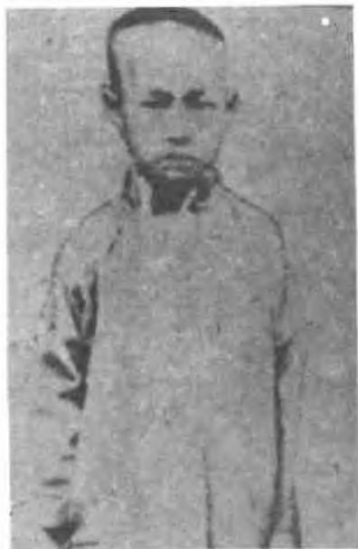
10岁摄于故乡湖南凤凰县