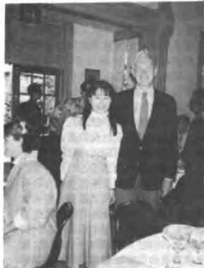
校长接见一年级新生