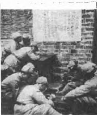
改编的原傅作义部队士兵学习我军《三大纪律八项注意》