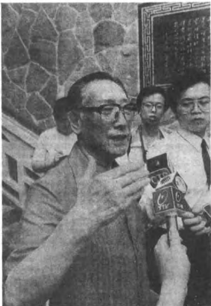
蒋纬国被记者包围询问有关枪支之事，他表示：肇发者别有阴谋