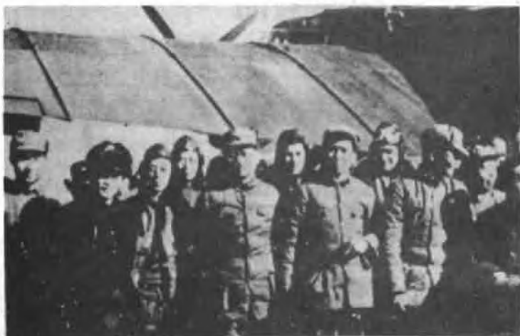
一九三七年十一月，毛泽东（前排右三）和张闻天（前排右四）等人在延安机场迎王明（前排右二）和康天从苏联回来

任弼时在共产国际工作的1938年至1940年间，在苏联的中国同志中也像苏联在常说“为了斯大林”那样，经常说“为了毛泽东！”共产国际机关对任弼时，则称他是“毛泽东信得过的人”。周恩来到了莫斯科，又称周恩来是“毛泽东的使者”。