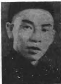
杜月笙。1927年蒋介石利用杜手下的流氓爪牙们帮他清除在上海的共产党