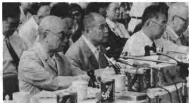
肖克(前左一)在奠基仪式上讲话,前排左起依次为李德生、荣高棠、乔晓光。

辛未金秋,滚滚黄河畔,苍苍邙山麓,龙旗龙灯腾舞,鸽群彩球凌空,礼炮鼓乐震天,欢声笑语遍地。郑州黄河游览区内,高悬“炎黄子孙不忘始祖”、“炎黄雄姿存天地,凝聚四海赤子心”等横幅。著名的红军将领、中华炎黄文化研究会执行会长肖克和中共中央顾问委员会常委李德生、委员荣高棠、乔晓光;全国侨联主席庄炎林和著名茭菰生物学家牛满江等海内外名人学者及中华炎黄文化研究会负责人,还有来自北京、天津、上海、湖北、福建、广东和内蒙古等省市炎黄文化研究会或筹委负责人,来自美国、新加坡、香港和台湾等地的贵宾,在河南省、郑州市领导人陪同下,围着由全国人大常委会副委员长、中华炎黄文化研究会会长周谷城题写,刻着“炎黄二帝巨型塑像奠基”等字的石碑,一齐挥锹破土,宣告了亿万炎黄子孙翘首期盼的这项伟大工程的如期开工。