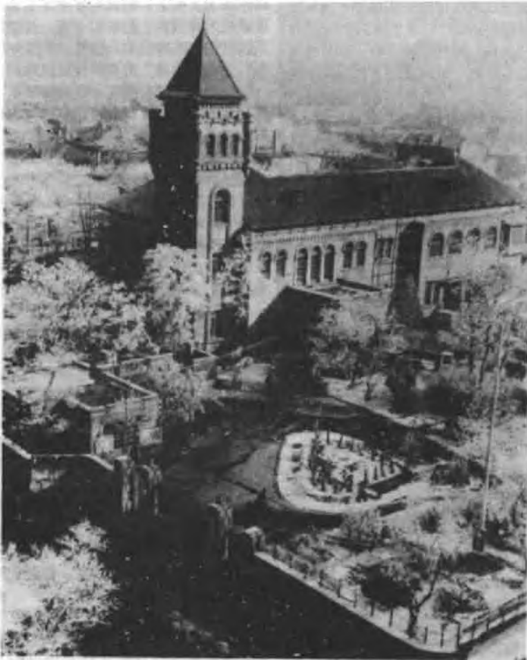
溥仪寓居天津时所住的张园（现为天津日报社址）

只要是拿着联系军人、拥护复辟这张门票，便可走进张园。特别是1926年起，一批批的光杆司令和失意政客涌进了租界。他们的眼睛不是来看这位无权无势的“逊位皇帝”，而是盯在溥仪手中文物珍宝、金钱古玩上。一个叫刘凤池的失业小军阀，曾向溥仪建议让其拿出一些古玩、玉器和金