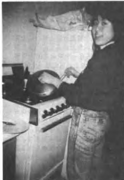
课余制作中国菜肴

从那天起，我无论走到哪里身上都带着一本袖珍英汉字典，听到我不会的字或词，抓住身边的同学，就要他们等我查出来并指给我看。在学校里，我又有了很多的“小老师”，我说话用词不当，或是语法用错了，音读得不准，不管当着多少人的面，他们都会大声地纠正我。开头我在众目睽睽下，很不好意思，但是不好意思的结果，反倒都记住了。