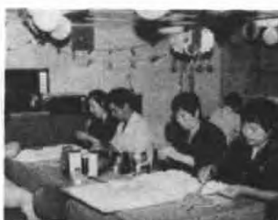
年三十，两岸海员同包团圆饺子