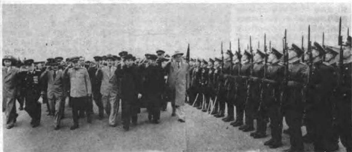
1952年8月17日—9月22日，周恩来总理率领中国政府代表团访问苏联，抵达莫斯科时，由苏联领导人陪同检阅仪仗队。

周恩来100余页的报告，由波诺马廖夫（当时任季米特洛夫的政治秘书，后为苏共中央政治局候补委员）压