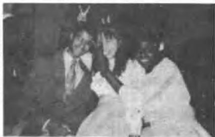
在一年级新生典礼上