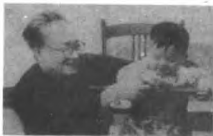
63岁的沈从文和不满一岁的孙女的，填补了文献的不足，对研究眼下热门的气功、导引也是有用的材料。

在东堂子胡同那间小屋，有一天沈先生应我请求，给我讲了我国玻璃（即玻璃）发展的历史。他说玻璃的发现应是很早的事情，史前人烧陶的时候，就可能有些矿物质烧熔结晶出来，便是最初的玻璃珠子。后来掌握了各色玻璃的烧造技术，用于装饰。这技术在历史上曾经失传，到隋代何稠又给恢复起来。沈先生很推崇何稠这位有许多发明的少数民族人物，由于他的发现，隋唐时的玻璃器就不都是舶来品，也有内地生产的，按质地是否铅玻璃就可以区别开来。但是还很珍贵，唐代诗人互赠礼品，就有只送一只夜光杯的。为什么后来我们的玻璃工艺长期停留在做装饰品为主的水平，没有像西方一样迅速发展平板玻璃和玻璃器皿呢？沈先生解释，是因为中国的窗户纸、丝绸和瓷器太发达了，用丝绸和纸糊窗户，透光透气，