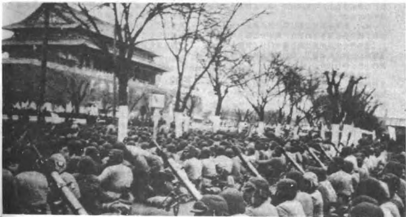
庆祝北平和平解放群众大会会场