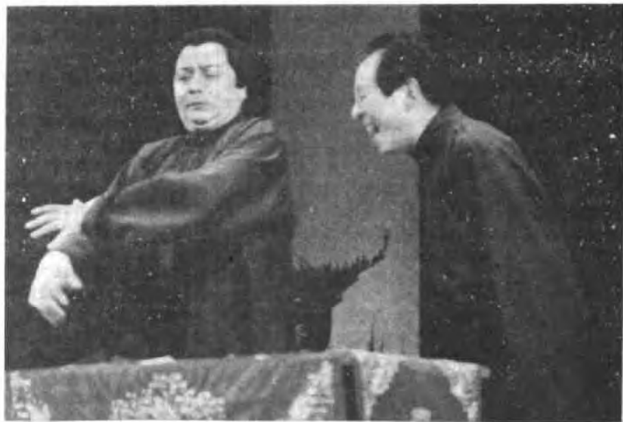
一位鼻梁挺耸得有些高傲、眼睛深凹得有些忧伤、浓密的黑发卷曲得使人心醉的男士；一位经常是妙语如珠、幽默得令人忍俊不禁、曲终人散仍使人百般思索的艺术明星，他总是步履匆匆，从北京到长白山，到上海、广州、香港、新加坡、东南亚……他又常常来到我们中间——在各大体育场、在千家万户的电视荧光屏上……

从外在形象看，他献给我们的似乎应是意大利歌剧、欧洲芭蕾或北美摇滚；待到他一张口，却是纯正的京腔京白、源远流长的中国相声——植根于几千年东方热土的东方文化。外在与内在的反差，典型的西方人长相却酿造着迷人的东方艺术，这就是著名笑星李金斗。他自1979年初在首都舞台上爆红之后，曾连续摘取1986、1987年全国曲艺大奖赛第一名、1988年全国相声邀请赛第一名的桂冠，接着，又获取1989年禹王亭杯笑星金奖和1990年铜陵杯奖。1987年底，李金斗应邀去新加坡旅演，又引起轰动。《联合早报》等新加坡七、八家报纸连篇累牍评介李金斗的相声艺术；新加坡社会发展部部长握着他的手说：“非常高兴你给我们送来了精湛的中国相声艺术。从这儿，我们寻到了东方文化的源，找到了相声艺术的根。”