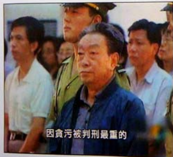
因貪污被判刑最重的

鄧小平又轉回身指著我說：「有人說你陳希同帶資味，不要緊嘛！」他講的四川話，我聽懂了，是講「資味」，不是「滋味」。鄧小平又接著說了一句很重要的話：「不是說我搞資本主義嗎？！我很高興！」。1992年3月22日。