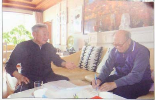
陳希同：回想「六四」，我認為是一場可以避免、應當避免而沒有避免的悲劇，中央動盪，我不願意。上邊的鬥爭，爭論，我不知道。