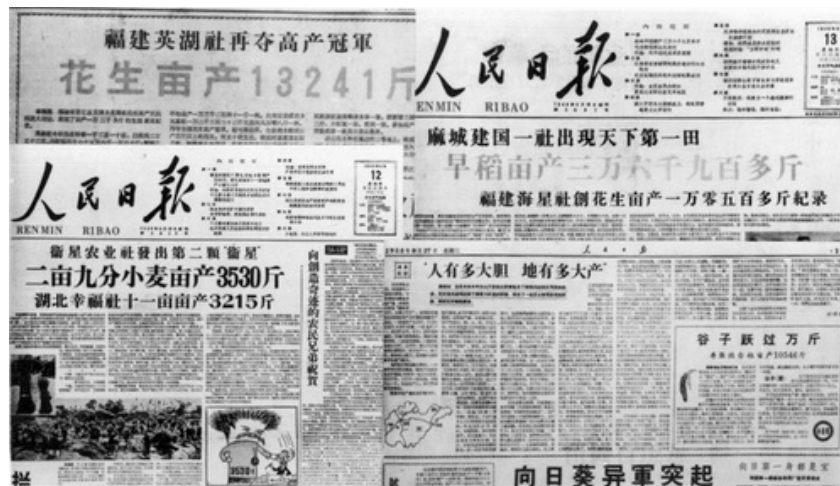
《人民日报》有关农业“卫星”的报道

大饥荒档案 www.chinafamine.net 引用或转载请注明著(译)者及出处